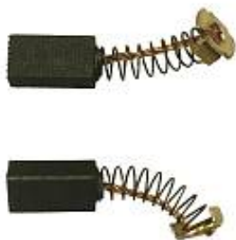
Щетки электродвигателя для шлифовальной машины AS-A1/D3 арт.100626